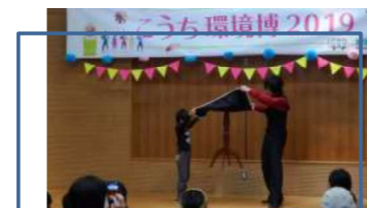
お楽しみステージイベント