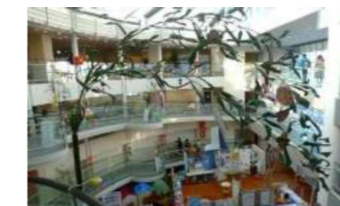
【会場】こうち男女共同参画センター ソーレ

【お問合せ】「こうち環境博2020実行委員会」事務局 特定非営利活動法人 環境の杜こうち