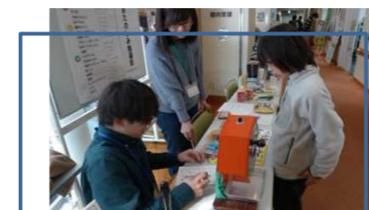
スタンプラリーと抽選会