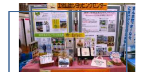
環境にやさしい高知のかいしゃ紹介コーナー