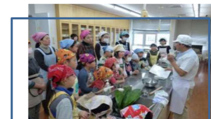
調理や工作などのワークショップ