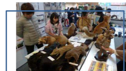
体験プログラム・展示ブース