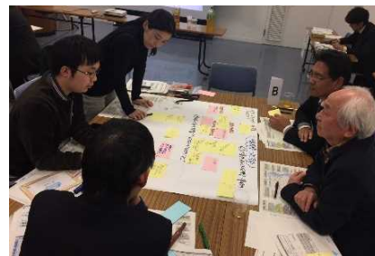
徳島市における気候変動ワークショップの様子

そこで、環境省中国四国地方環境事務所では、この事業の取組の一環として、 地域のみなさんと一緒に、地域にどんな影響が起きているのか？また、起ころうとしているのか？ を知り、 気候変動に対して自分たちの地域で何ができるかを考えるため に「気候変動影響事例調べワークショップ」を開催します。是非、ご参加ください。