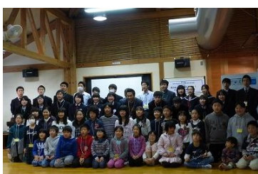
交流会での発表・共有

「美南国に集まれ！子どもeco活動交流会」は、学校関係者並びに地元企業・地域住民のみなさまのご協力のもと開催する事ができました。平成28年度からの取り組みは、これまで以上に流域内の企業・団体のみなさまと、学校・子ども達をつないでいきます。施設見学や出前授業、環境活動などの体験学習をサポートし、その成果の発表・共有の場となる「美南国に集まれ！子どもeco活動交流会」が、さらに良き交流の場となるよう関係者一同努めて参ります。今後ともこれら子どもたちの活動にぜひ、ご理解ご協力をお願いします。