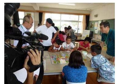
子どもたちの取組の情報発信