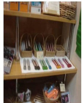
おしゃれなエコグッズ達