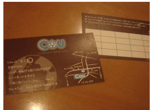
貯まると嬉しいスタンプカード