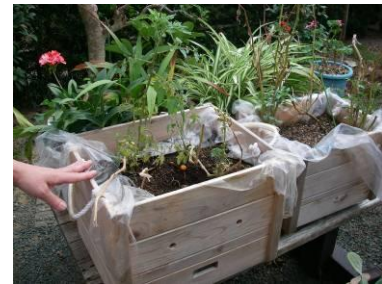
もくもく菜園キット

高知のヒノキ間伐材を利用した木製プランター・特殊有機培養土がセットになった家庭菜園キット。必要なものはすべて含まれているため、買ったその日から手軽に家庭菜園を始められる。(第5回エコ産業大賞を受賞)