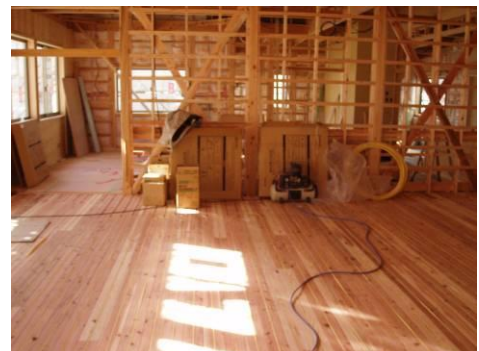
無垢床暖の施工風景