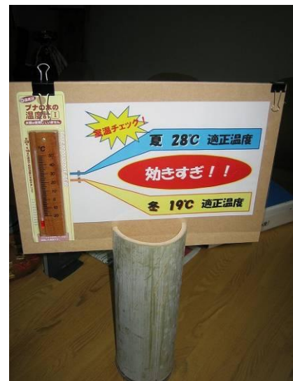
目で見て確認できることが大切！