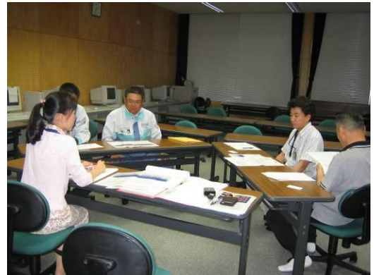
導入前のシステム説明