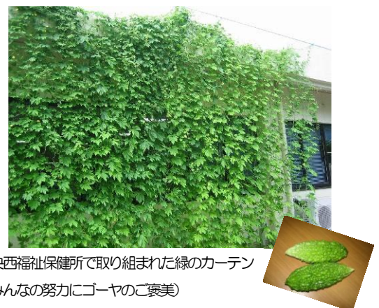
中央西福祉保健所で取り組まれた緑のカーテン (みんなの努力にゴーヤのご褒美)