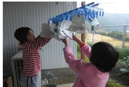
牛乳パックリサイクル