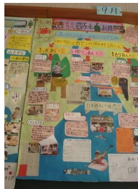
エコチェックカード