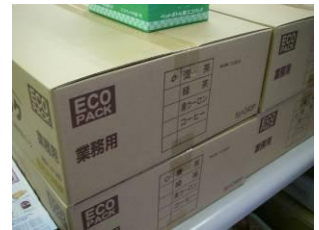
ダンボールも軽量化

ペットボトルを使ったお茶パックをみた時、ペットボトルにもいろいろな種類があるため使い勝手が悪そうと感じた。それなら改良すべきだ！と思い立つ。ただエコだというだけでなく、使いやすさ（アイデア）にこだわったスティック型ティーパック商品。 水出しであるため、煮出すエネルギーも必要ない。