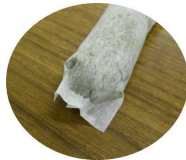
入れやすさのポイントは先端の形状 既存品の「平ら」から「丸」へ！

※使い終わったペットボトルに エコパック茶と水を入れて 冷蔵庫で一晩寝かせるだけで完成！ 朝には美味しいお茶ができています。