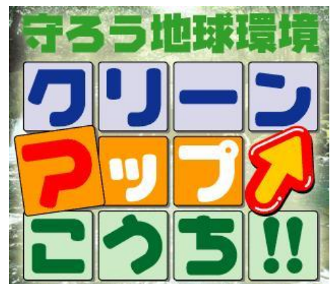
地球環境を守るキャンペーン

「ぶちエコはじめよう」と「地球の気温を自分の体温におきかえて」という2つのCMを放送し温暖化防止を呼びかけ。