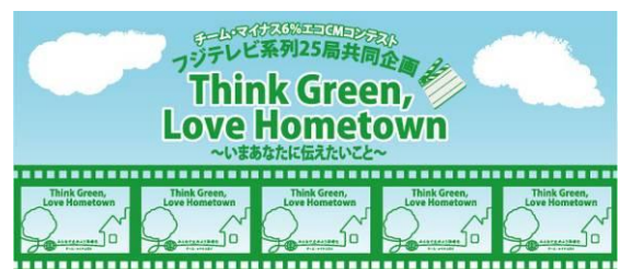
温暖化防止の全国キャンペーン