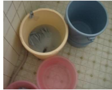
「米のとぎ汁発酵液」と洗剤を少し入れた「たらい」で漬け置きして汚れをおとす