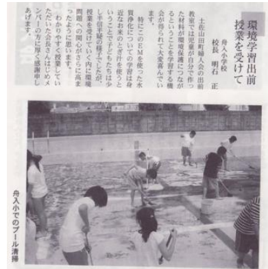
(活動紹介：婦人会広報紙より)