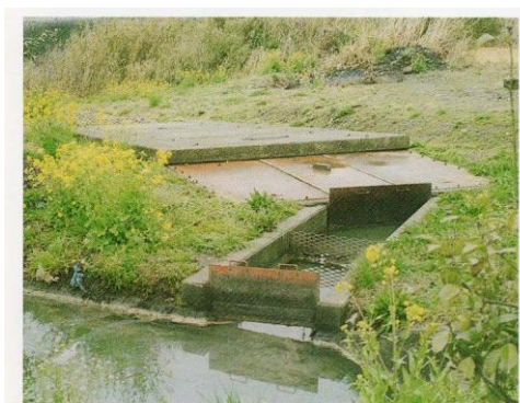
旧十和村交流センター設置状況